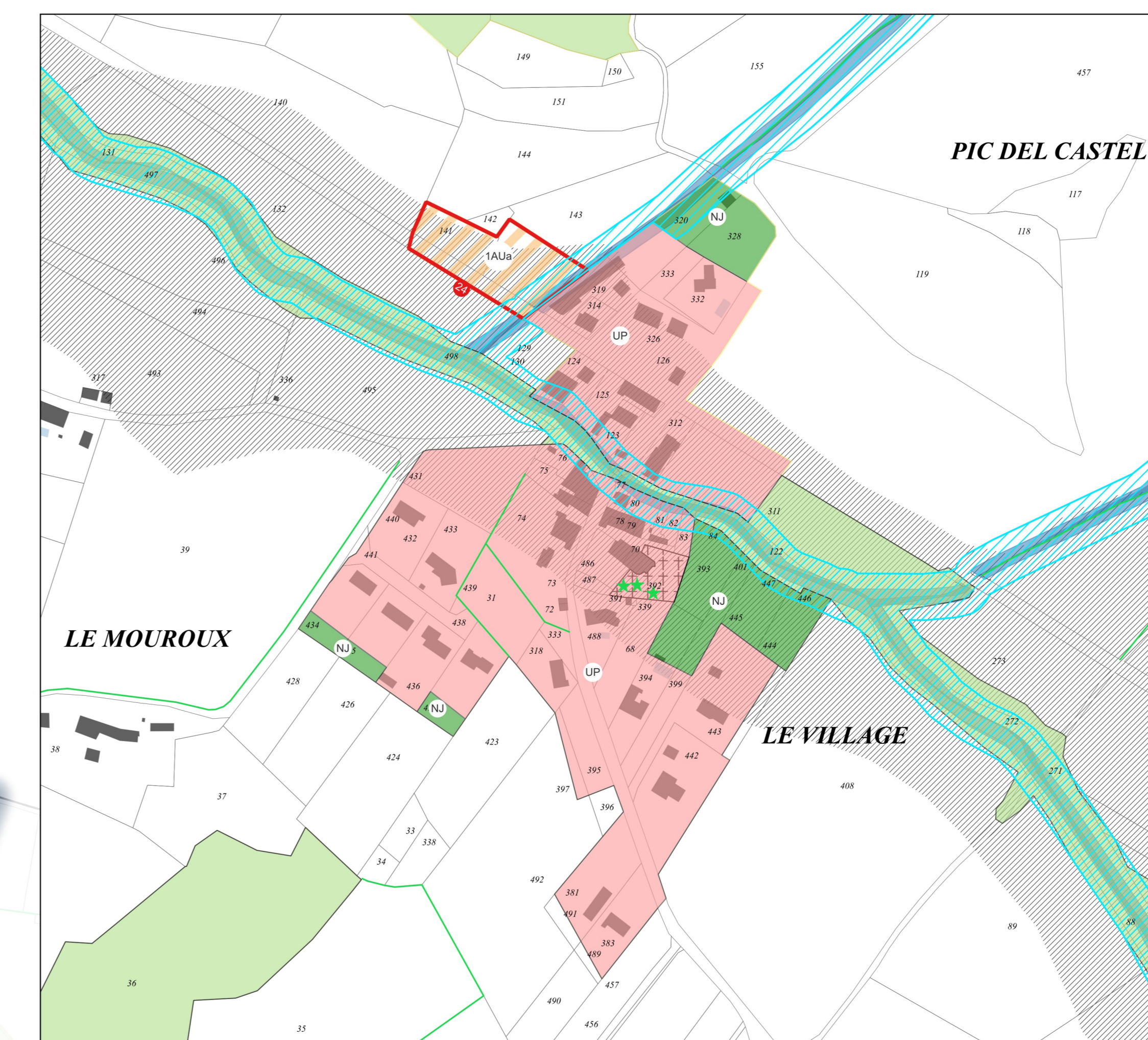
Zoom du centre au 2 500e